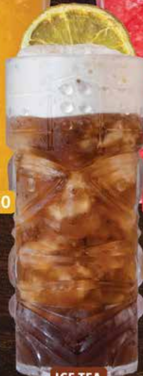
ICE TEA $85

Las imágenes son de carácter ilustrativo. La presentación real de los productos puede variar, ¡pero el sabor siempre está garantizado!