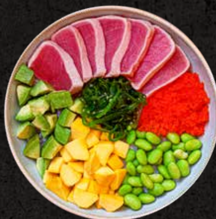
Seared Tuna Bowl 70g

Atún sellado con mango, aguacate, edamames, seaweed salad y masago, servido sobre una cama de arroz.