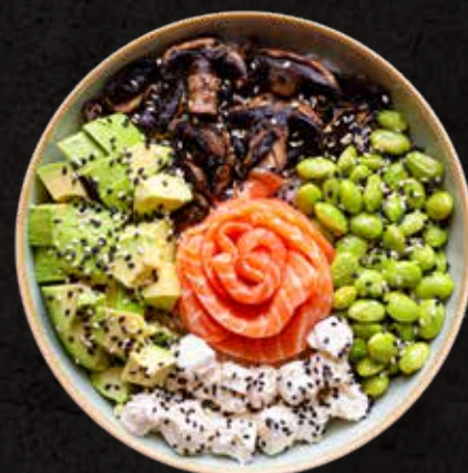
Shake Bowl 70g

Champiñones a la plancha, edamames, aguacate, queso crema, láminas de salmón fresco y ajonjolí, servidos sobre una cama de arroz. Acompañado con aderezo de habanero.