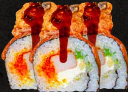
Geisha Roll 10 piezas

Delicioso rollo envuelto con alga nori y láminas de salmón fresco. Por dentro kanikama, aguacate, queso crema y masago. Con topping de albacore y anguila, ligeramente spicy y flameado. Bañado con salsa de anguila y ajonjolí.