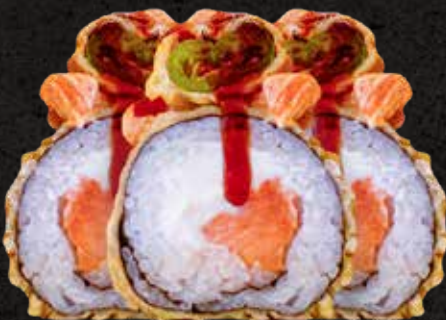
Tempura Sake Roll 10 piezas

Delicioso rollo tempura. Por dentro salmón fresco y queso crema. Con topping de salmón fresco ligeramente spicy y con rodajas de chile serrano. Bañado con salsa de anguila y ajonjolí.