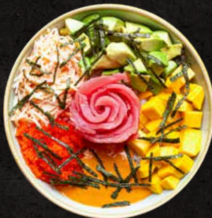
Tuna Bowl 70g

Ensalada de kanikama, mango, aguacate, masago, láminas de atún y julianas de alga nori, con aderezo de chipotle sobre una cama de arroz.