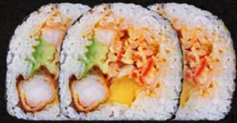
Aso Roll 7 piezas

Delicioso rollo envuelto en alga nori. Por dentro ensalada de mariscos, mango, aguacate y camarón empanizado. Acompañado con salsa spicy.