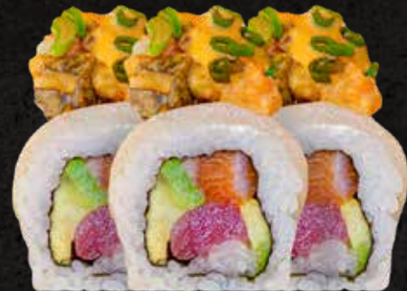
Rollo Sugo 10 piezas

Delicioso rollo envuelto con queso crema y láminas de albacore. Por dentro atún, salmón y aguacate. Con topping de aderezo spicy ligeramente flameado. Bañado con chispas de tempura y cebollín.