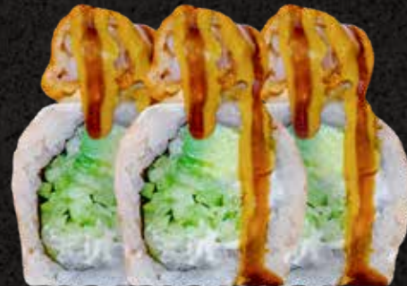
Fuji Roll 10 piezas

Delicioso rollo envuelto en arroz. Por dentro aguacate, queso crema y pepino. Con topping de aderezo de masago, camarones roca y cebollín. Bañado con salsa de anguila, salsa de la casa y ajonjolí.