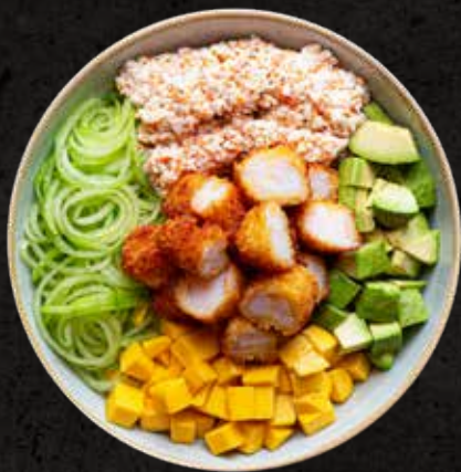
Ebi Bowl 50g

Camarón empanizado, aguacate, mango, hilos de pepino y tampico, sobre una cama de arroz. Acompañado de salsa de la casa (salsa fuji).