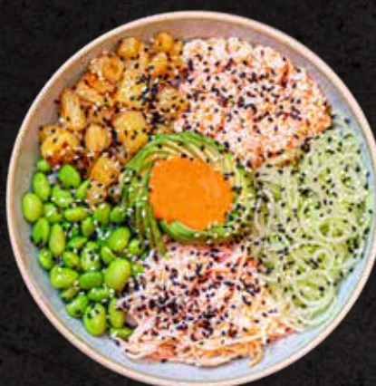
Kani Bowl 70g

Hilos de kanikama y pepino, edamames, tampico y piña asada sobre una cama de arroz. Acompañado de salsa de chipotle y una mezcla de ajonjolí tostado.