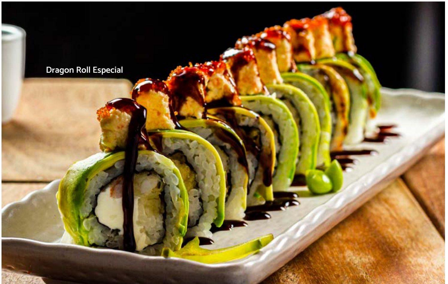
Dragon Roll Especial