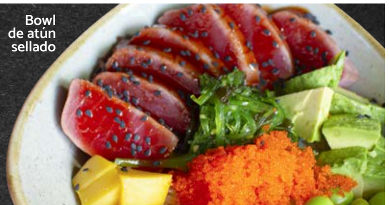
Bowl de atún sellado