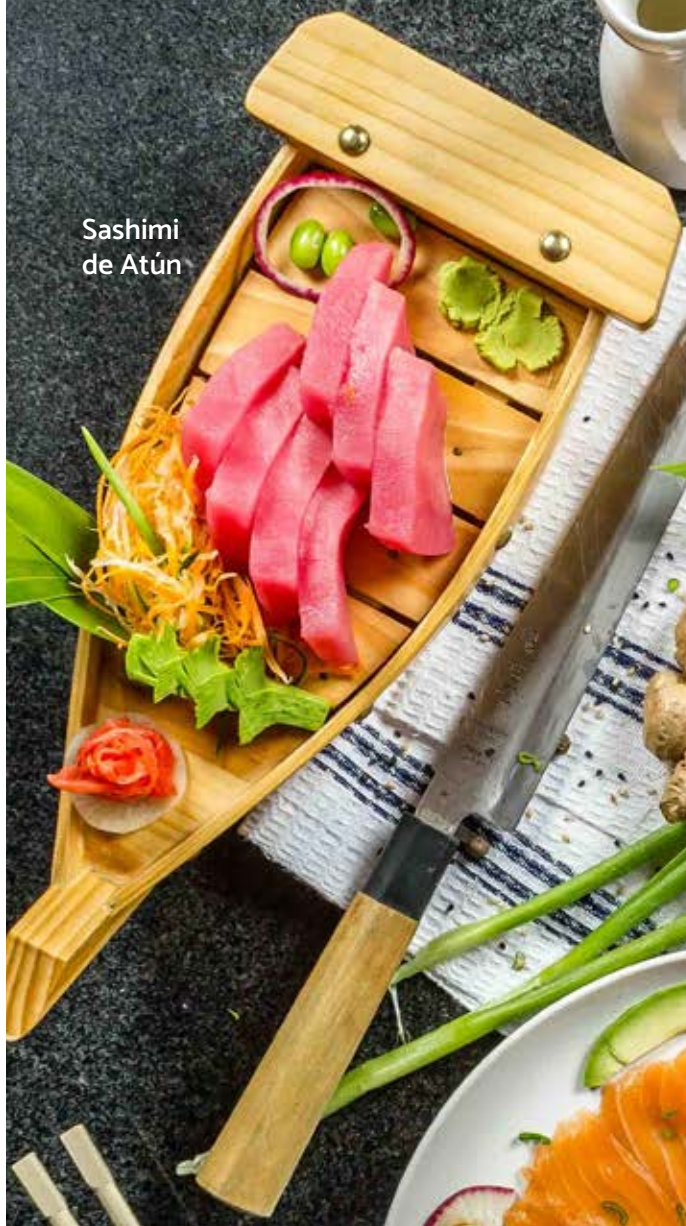
Sashimi de Atún