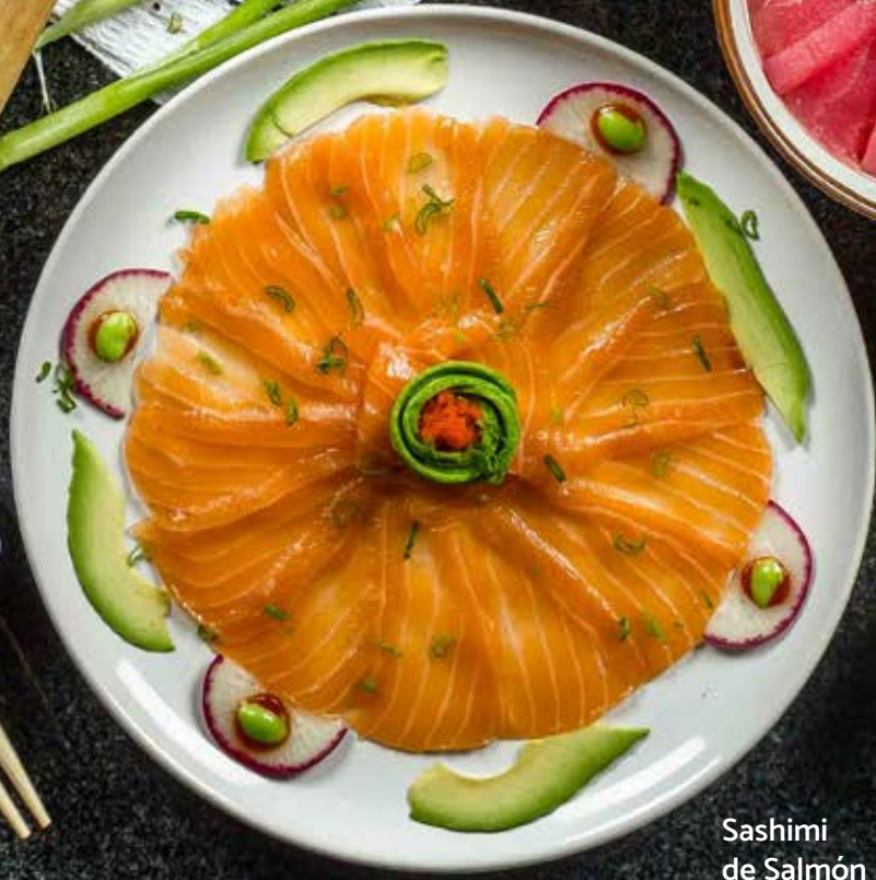
Sashimi de Salmón